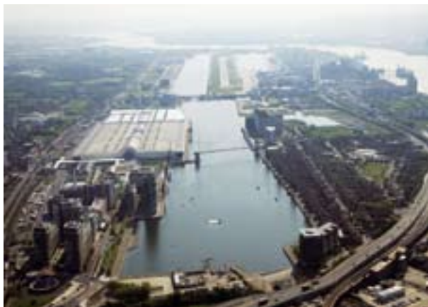
The London Docklands, left: the ExCeL exhibition grounds, right: London City Airport.

ort liegt auf einem 40 Hektar großen Campus, mit drei ‚Docklands Light‘ Railway-Stationen, direktem Zugang zur Jubilee Line der Londoner U-Bahn und gutem Anschluss an den London City Airport, Parkmöglichkeiten für 3.700 Autos, fünf Hotels vor Ort sowie zahlreichen Bars und Restaurants.