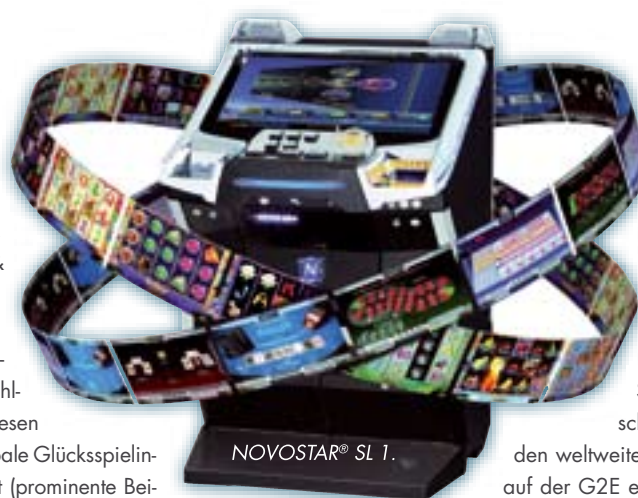
NOVOSTAR® SL 1.

Der Umzug der Show stellt die Aussteller vor neue logistische Herausforderungen, will man sich doch auch am neuen Messe-