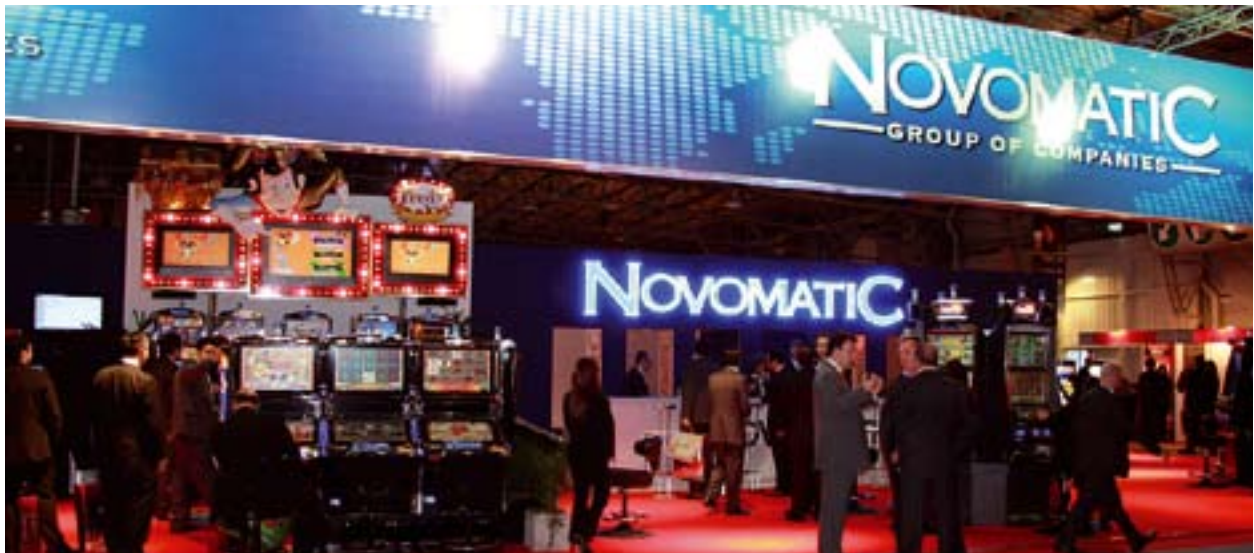
The Novomatic booth at SAGSE 2010.