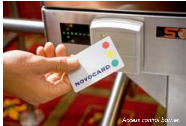
Access control barrier.

Das Novocard®-Zutrittskontrollsystem wurde von Austrian Gaming Industries GmbH (AGI), einer 100-prozentigen Tochtergesellschaft der Novomatic AG, entwickelt. Als richtungweisendes System wurde die Novocard® seit 2007 in allen niederösterreichischen Spielbetrieben der Gruppe (Admiral Sportwetten-Outlets sowie Admiral Entertainment-Spielhallen) erfolgreich als elektronisches Zutritts- und Spielerschutzsystem eingeführt. Neben dem Aufbau einer zukunftsfähigen technischen Infrastruktur war es auch Anspruch von Novomatic, ein System zu schaffen, das höchsten rechtlichen Anforderungen genügt, um für zukünftige Entwicklungen im Datenschutzrecht gerüstet zu sein.