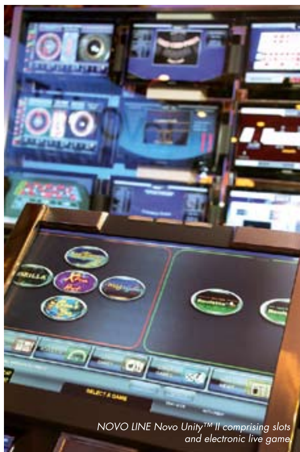
NOVO LINE Novo Unity™ II comprising slots and electronic live game.