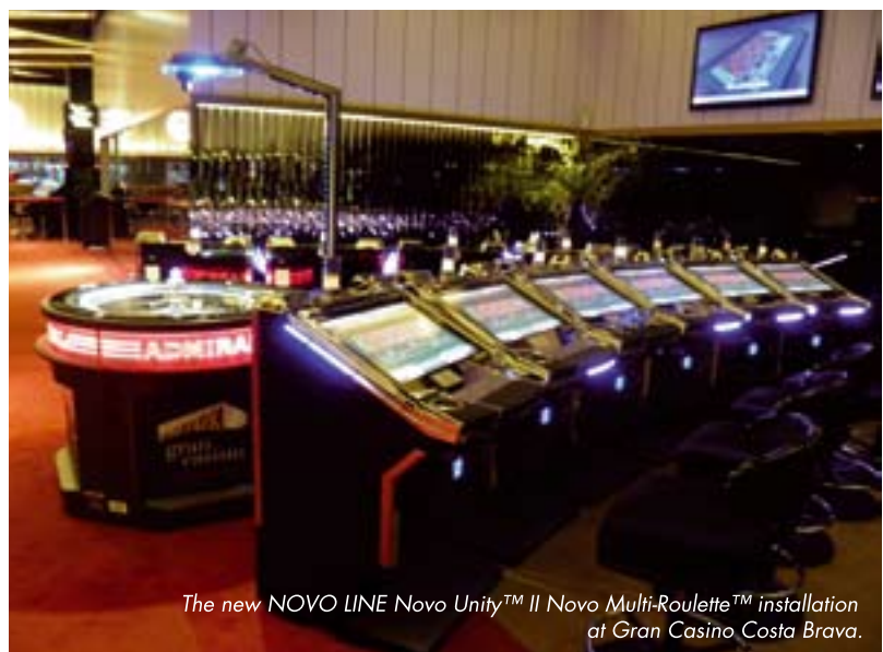
The new NOVO LINE Novo Unity™ II Novo Multi-Roulette™ installation at Gran Casino Costa Brava.