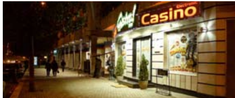
ASTRA slots arcade in Albania.

With currently 71 gaming operations that are operated by two local subsidiaries, Novomatic has firmly established a strong position in the Albanian premium segment. The guests appreciate the sophisticated gaming offering and the excellent service in the gaming arcades operated under the 'ADMIRAL' and 'ASTRA' brands.