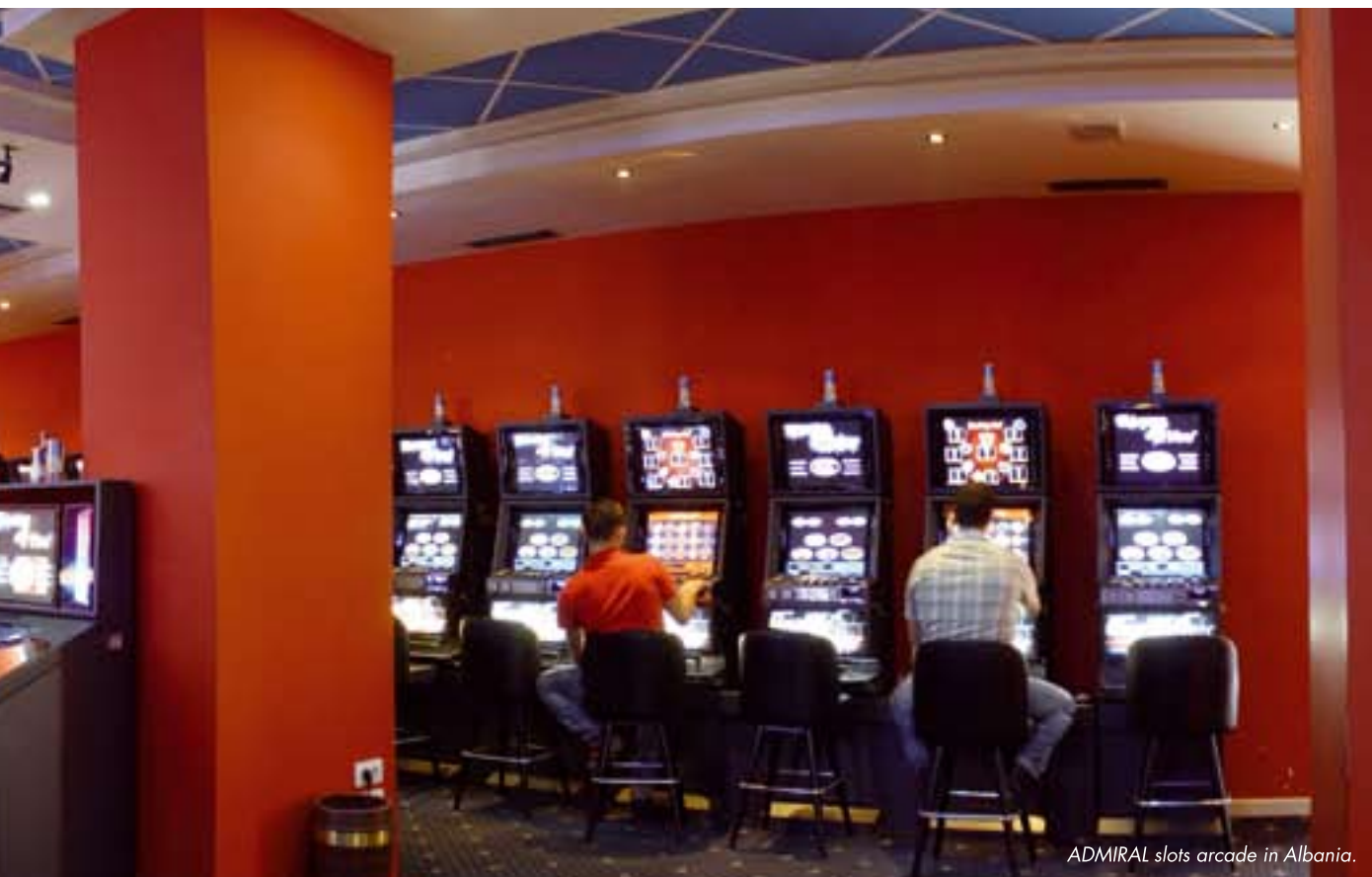
ADMIRAL slots arcade in Albania.