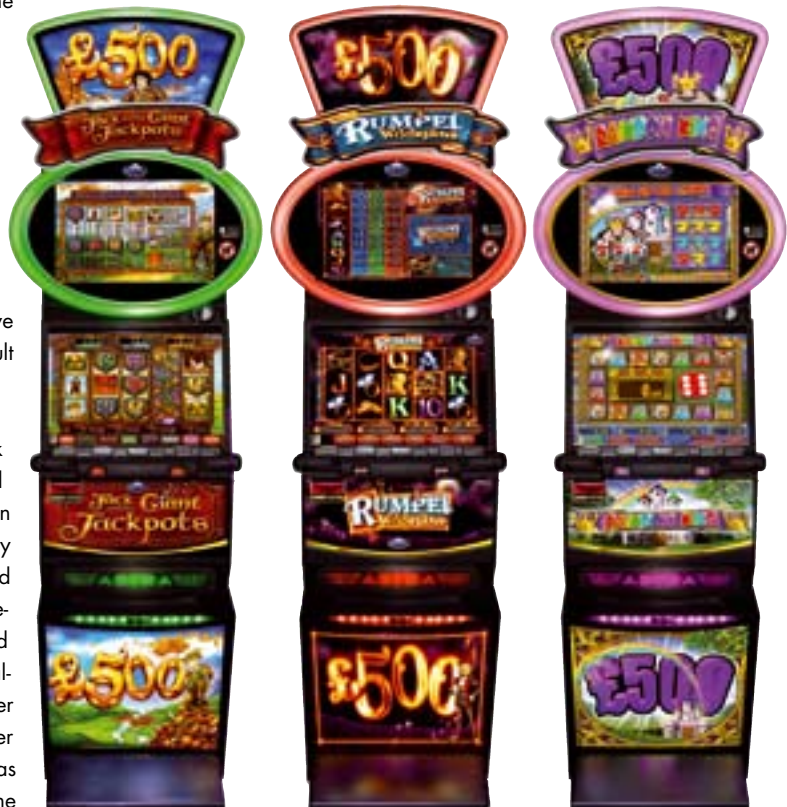
Jack and the Giant Jackpots, Rumpel Wildspins and Rainbow King.